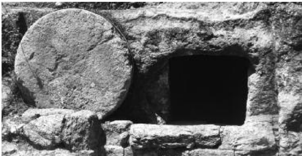
Sepolcro scavato nella roccia risalente all'epoca di Gesù.

Ecco perché il Volto Santo di Manoppello è un ologramma. Esso, essendo stato formato dalla Luce Eterna , adempie la profezia di Isaia, 52, 14-15, dice il ricercatore : “in questa Effigie ci sono i segni del Volto sfigurato di Cristo, Risorto dai morti e ci sono i segni del Volto trasfigurato di Cristo Risorto, perché illuminato anche dalla Luce del Padre, e salito al cielo”.